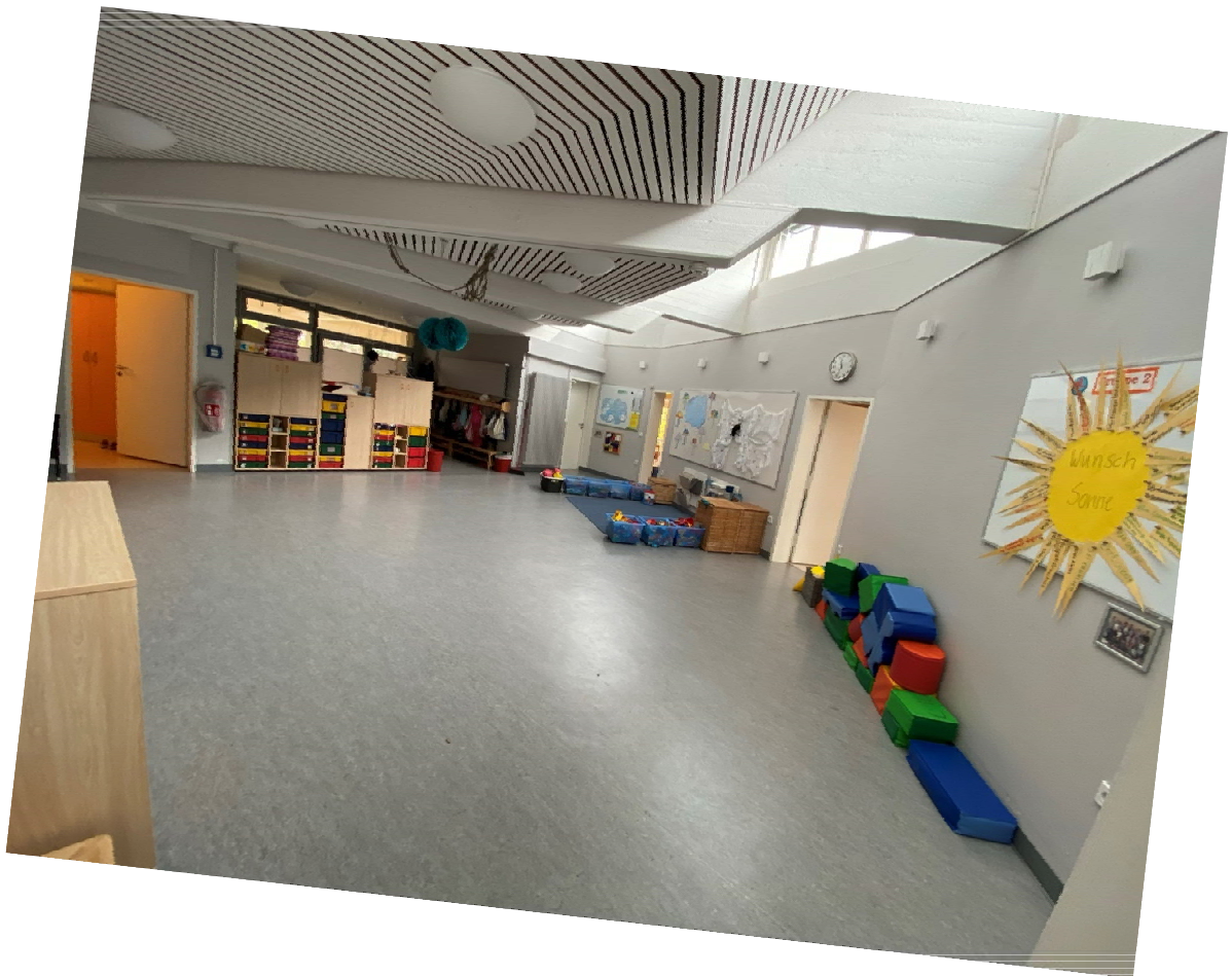
Der Große Raum vor Gruppe 1 und 2

Jetzt kommen wir schon zum Elementarbereich. Hier haben wir zwei Abteilungen: in der unteren Abteilung befinden sich die Gruppen 1 und 2, in der oberen Etage befinden sich Gruppen 5 und 6. Im Elementarbereich sind pro Gruppe ca. 25 Kinder und drei Gruppenerzieherinnen bzw. -erzieher. In der unteren Abteilung sind zwei Integrationserzieherinnen bzw. -erzieher tätig, in der oberen Abteilung eine Integrationserzieherin und ein Integrationserzieher in Ausbildung. Wir betreuen Kinder ab 3 Jahren bis zum Schuleintritt.