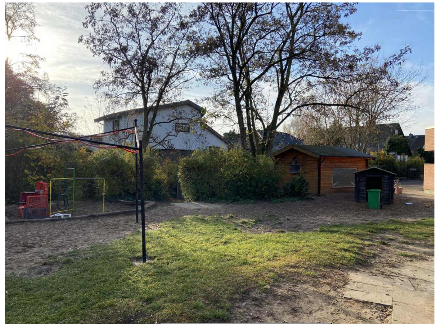
Unser großer Garten