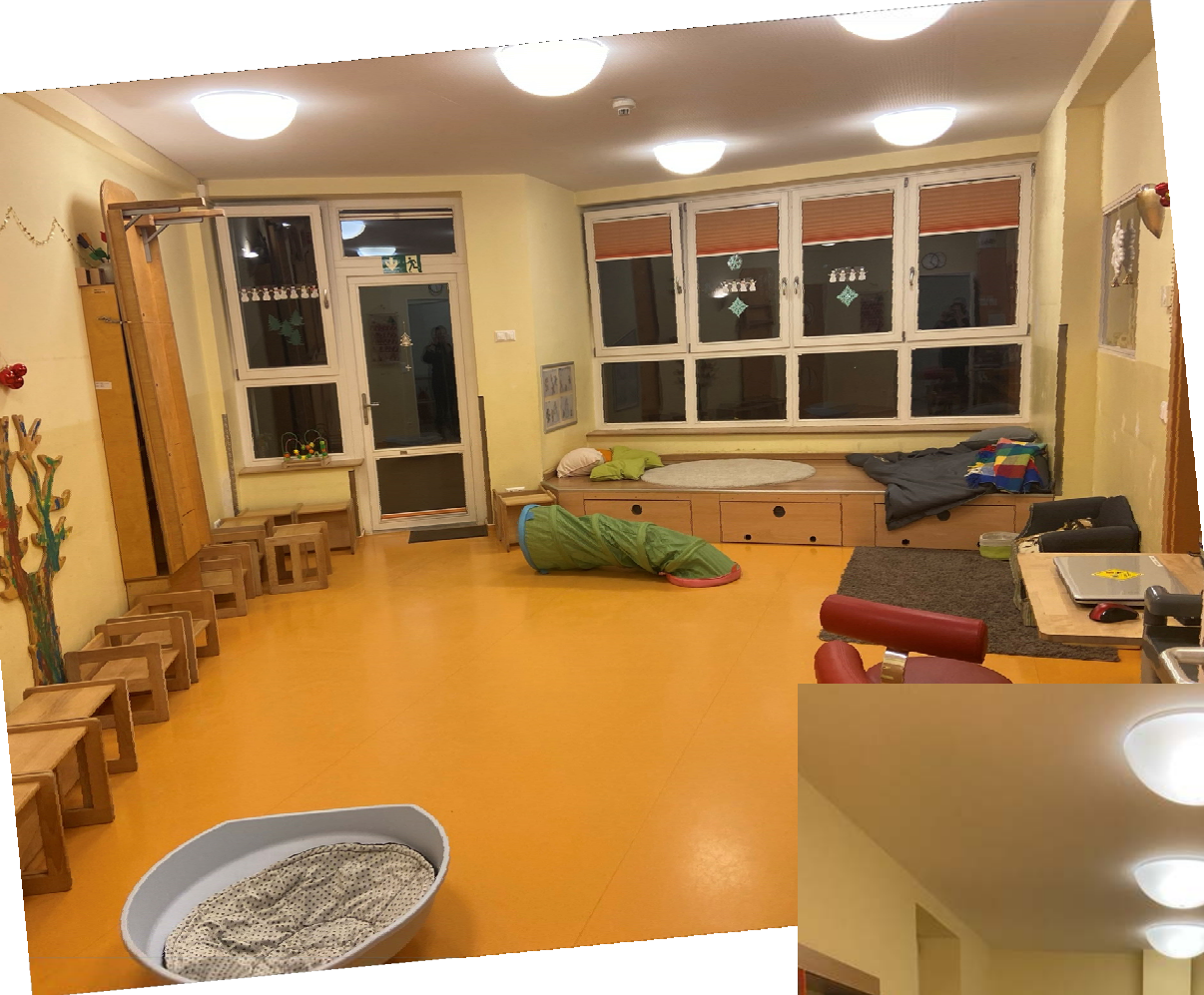
Die Gruppenräume von Gruppe 4